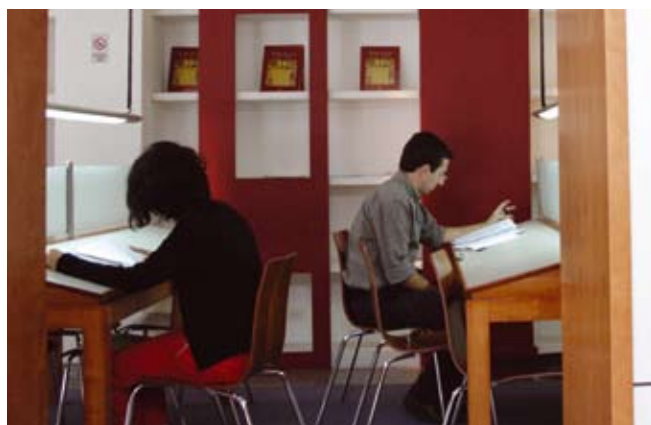
Biblioteca Adrián Guissarri, UCEMA.

Además, la Biblioteca ofrece para cualquier consulta un servicio de chat vía Facebook de 15 a 18:30 h bajo el nombre "Biblioteca Adrián Guissarri UCEMA".