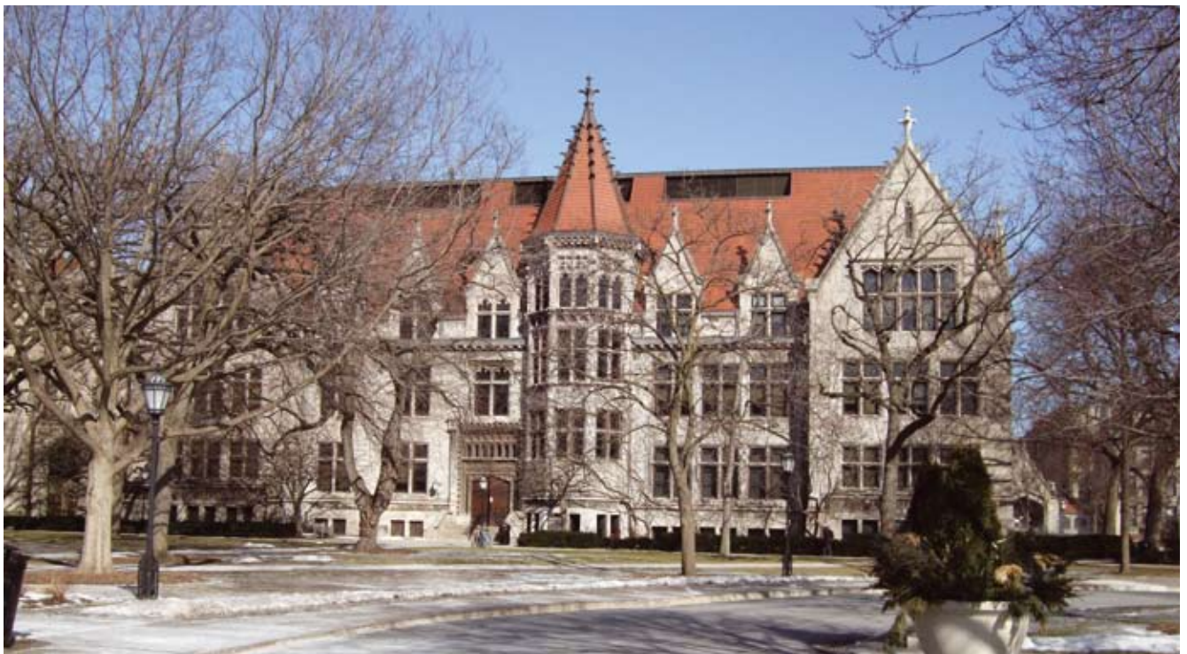
Universidad de Chicago.