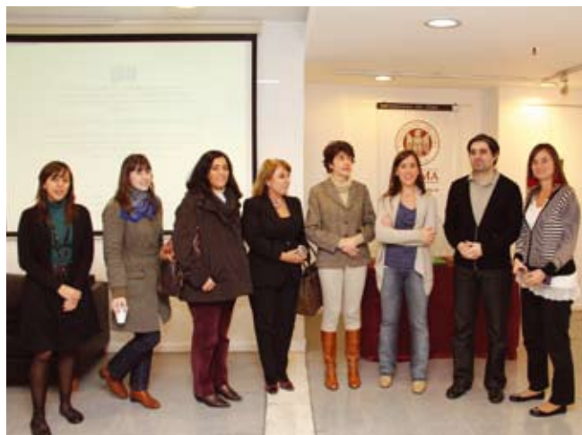
Ganadores del concurso de fotografía junto a autoridades.