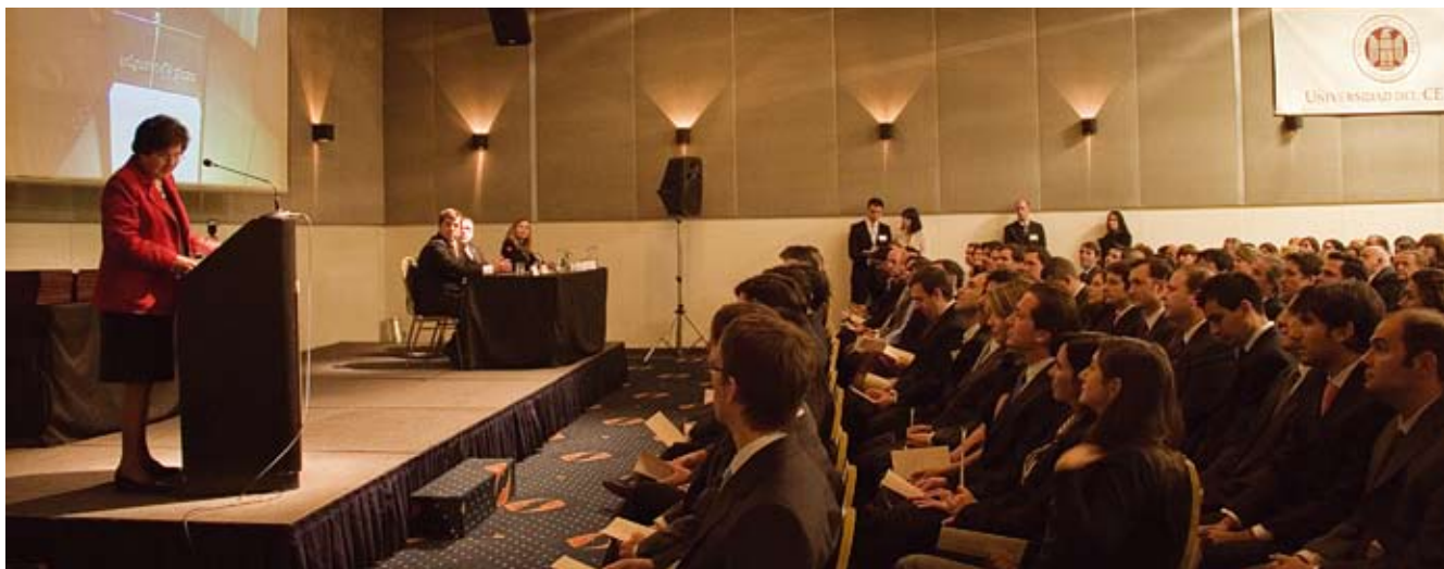
Ceremonia de Graduación del MBA, 9 de junio de 2011.