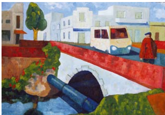
"El fabricante de inmortalidad". 50 x 35 cm. Óleo s/ tela. 2011. Marcelo Di Stasio.

La Universidad del CEMA inauguró el 24 de junio la muestra de pinturas "El fabricante de inmortalidad" de Marcelo Di Stasio, dentro del Ciclo de Arte 2011. La muestra estará abierta al público hasta el 26 de agosto pudiéndose visitar de 14 a 19 h en el SUM de la UCEMA, Reconquista 775.